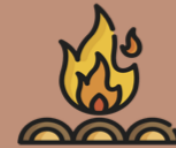
La acción de gracias