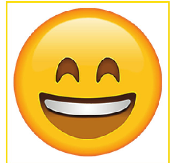
Excited • Emocionado/a