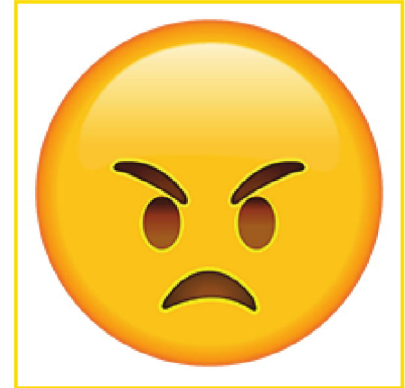
Angry • Enojado/a