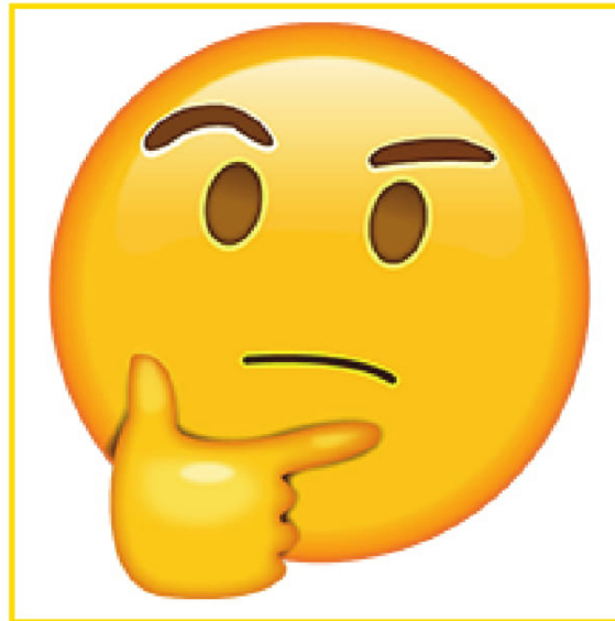
Confused • Confundido/a