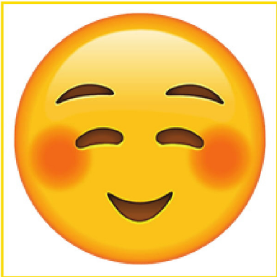
Embarrassed • Avergonzado/a