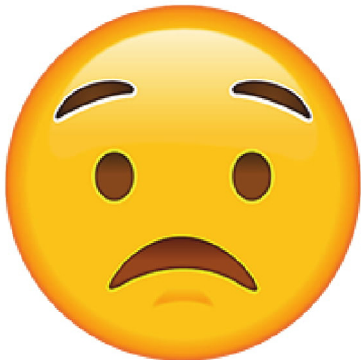
Worried • Preocupado/a