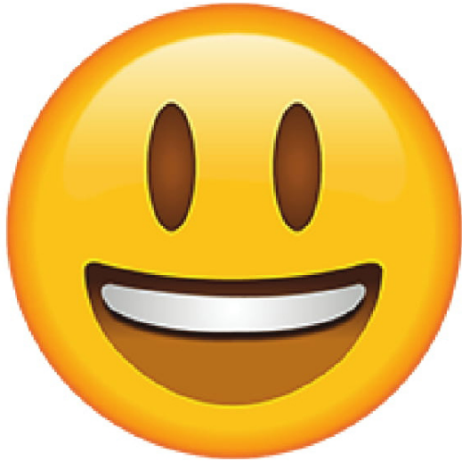
Happy • Feliz