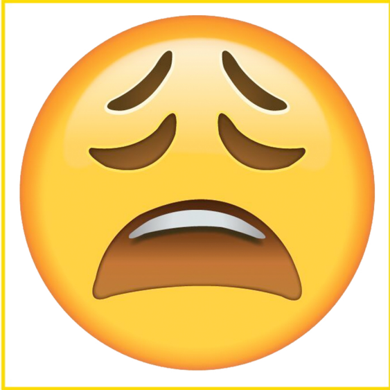
Tired • Cansado/a