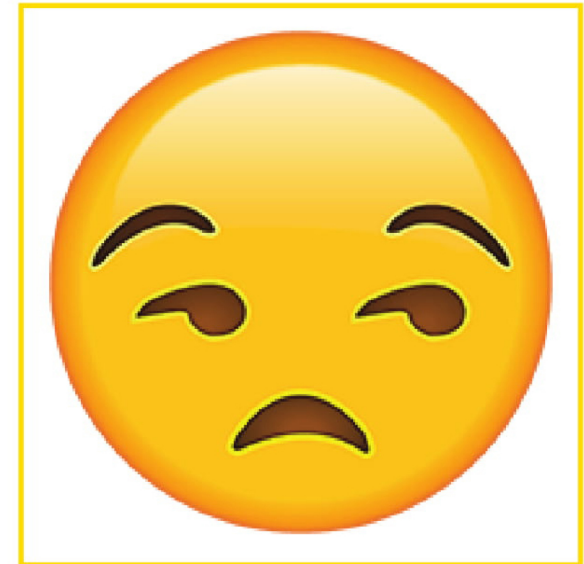
Bored • Aburrido/a