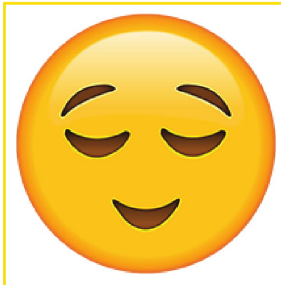
Shy • Tímido/a