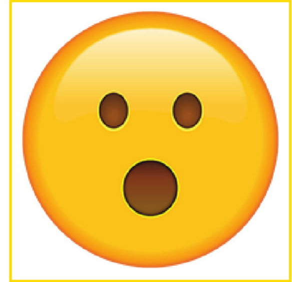
Surprised • Soprendido/a